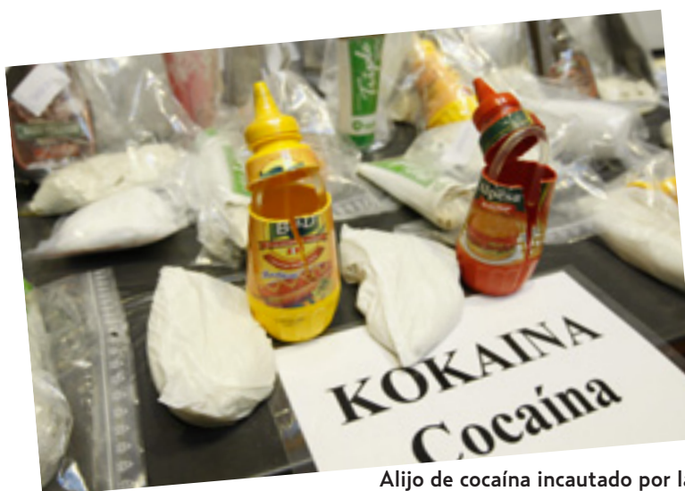
Alijo de cocaína incautado por la Ertzaintza.

"España, Holanda, Portugal y en cierta medida Bélgica" y que prosigue después en tránsito o como destino hacia Reino Unido, Francia y Alemania. En todo caso, los analistas confirman que el número de operaciones de incautación de cocaína no ha hecho sino aumentar en los últimos años, pasando de las 56.000 hasta las 99.000 en 2009, si bien el volumen de lo incautado y la pureza de la droga han disminuido considerablemente. En 2006 las autoridades policiales se incautaron de casi un centenar de toneladas aunque se redujeron a 49 en 2009. El documento también destila cierto optimismo